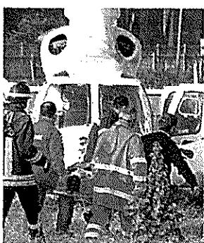
Il soccorso in elicottero e l'ambulanza