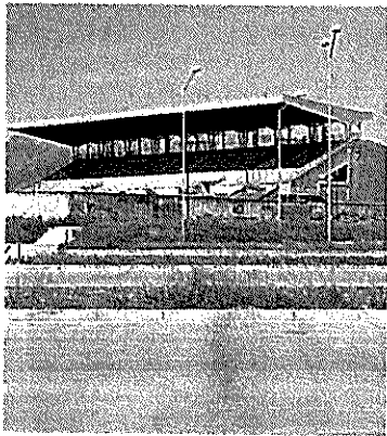
L'area del Casaleno