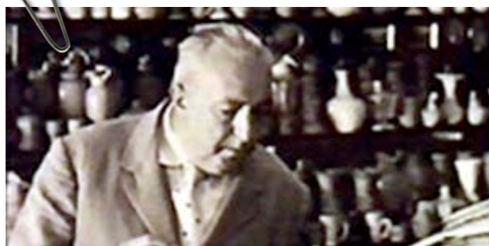
dangerously present - Gadda in a china shop

Our thanks go to all those who made the first edition of the Prize a success – the many Sponsors, the growing numbers of Friends , the hard-worked Panel Judges and Prize Committee Members, the voluntary helpers in droves, and, of course, the real protagonists of the initiative, the many senior and early career scholars and those talented Edinburgh boys and girls who entered their work.