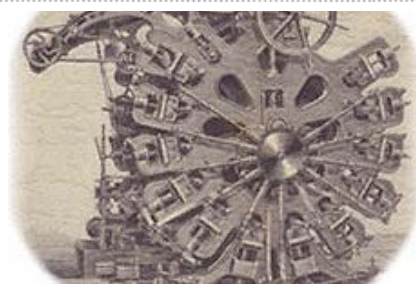
all about mind machinery