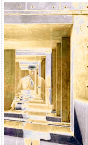
passing gateways – eigs style