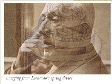
emerging from Leonardo's spring device

Chemotti, Saveria. 2009. L'inchiostro bianco. Madri e figlie nella narrativa italiana contemporanea . Padua, Il Poligrafo, 331pp., ISBN 978-88-7115-620-0.