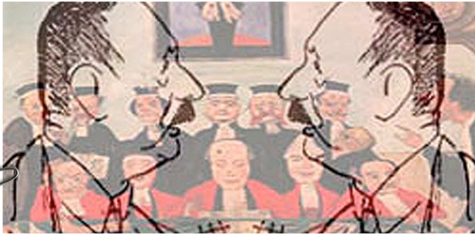
the good judges (after Ensor)