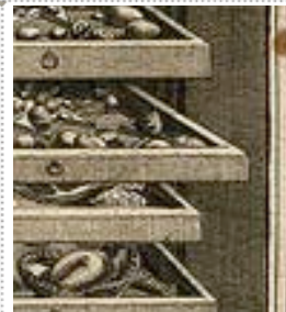
precious storage space

Want to make it happen? Become a Friend of Prize!